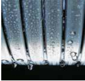
Inox-Radial-Wärmetauscher – langlebig und effizient