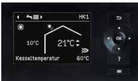
Display der Regelung Vitotronic 200