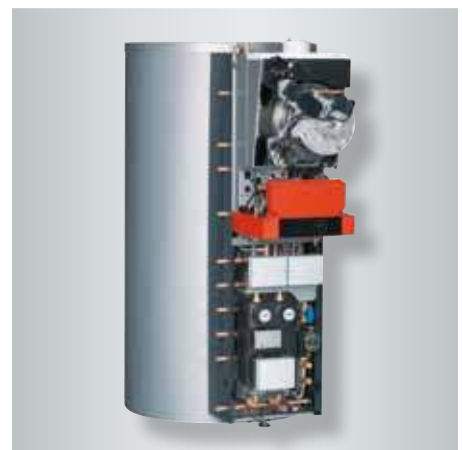
Vitosolar 300-F mit Öl-Brennwert-Wandgerät Vitoladens 300-W

In der Kombination mit einem Öl- oder Gas-Brennwert-Wandgerät arbeitet Vitosolar 300-F äußerst emissionsarm. Durch den Anschluss eines Festbrennstoffkessels für Holz oder Pellets ist der CO 2 -neutrale Betrieb zum nachhaltigen Klimaschutz möglich. Das Wandgerät hat dann die Funktion eines Spitzenlastkessels zur Erwärmung von Heiz- und Trinkwasser.